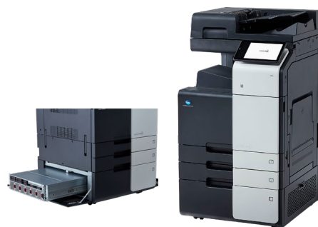
▲ Workplace Hub Smart

また、複合機と連携するクラウドサービスを利用することで、クラウド上の保管場所から印刷したり、スキャンした文書をクラウドに直接アップロードしたりすることができ、場所に縛られない働き方が実現します。環境や要件にあわせて、クラウドとオンプレミスを柔軟に組み合わせ利用することができます。