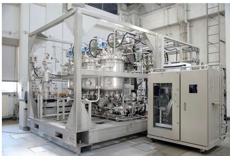
図1 実用化に向けて開発が進められているiFactory ® のモジュール(左)と自動分析装置(右)

今後はプロトタイプ製作と実証を進め、日本の医薬品製造における省エネルギー化・生産と資源の効率化に貢献する生産設備の構築と実用化を目指します。