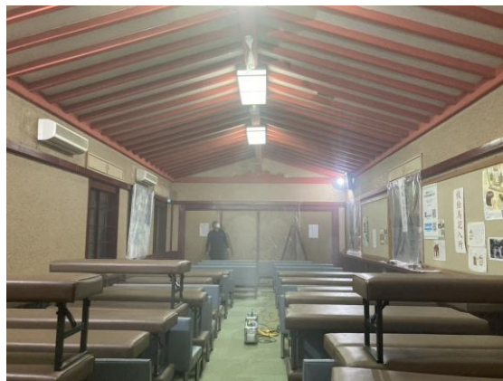
写真：春日大社 祈祷所での施工模様

コニカミノルタジャパンは、重要文化財でもある直会殿（読み：なおらいでん）の椅子をはじめとした備品や不特定多数の方が利用する祈祷所室内への施工を担当しました。