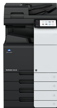
bizhub C360i S

「bizhub i Sシリーズ」は、場所に縛られないテレワーク中心の働き方と安心安全なオフィス出社中心の働き方、それぞれの働く場所に合わせた環境づくりをサポートします。