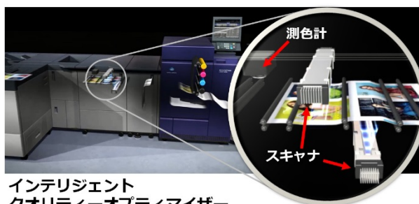
インテリジェント クオリティーオプティマイザー

コニカミノルタは、今後も「お客様のお困りごと」を解決するユニークな機能をIQ-501に継続的に搭載し、印刷会社の業容と収益の拡大に貢献してまいります。